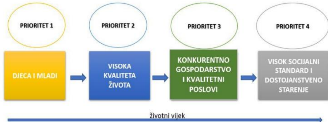
Slika 1. Prioritetna područja Plana razvoja Gorskog kotara