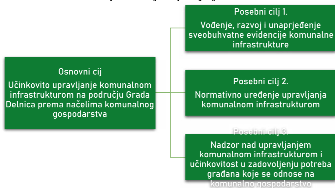
Grafikon 1. Osnovni i posebni ciljevi upravljanja komunalnom infrastrukturom