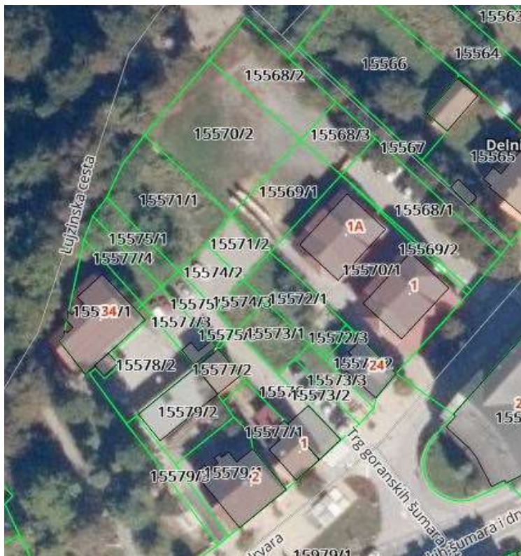
Realizacija Plana – službena geodetska podloga (DGU)